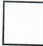
Huella digital (Índice derecho)