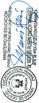
Modelo de Foliación (Referencial):

Toda la documentación (incluyendo la copia del DNI y los Formato) deberá estar debidamente FOLIADA en números naturales, comenzando desde la última página (de atrás hacia adelante). No se foliará el reverso o la cara vuelta de las hojas ya foliadas.